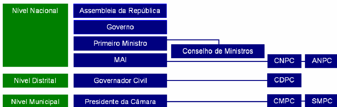
Estrutura da Protecção Civil Nacional

A estrutura de Protecção Civil em Portugal organiza-se ao nível nacional, regional e municipal, em conformidade com a Lei n.º27/2006, de 3 de Julho da seguinte forma: